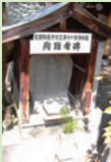
▲潜水艦殉難者碑 高野山釈迦院。

区は国防婦人会の発祥地ともなった。住友倉庫の屋上には高射砲が置かれ、部隊が駐屯していた。壁には「咲イタ話ニスパイハ踊ル」などの伝單が貼られていた（港区私たちと戦争展実行委員会が発見）。赤レンガ倉庫群には機銃掃射の跡も残る。