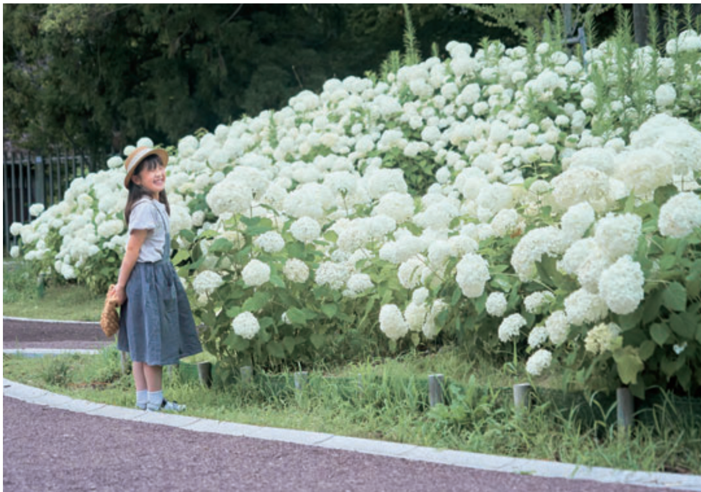
▲「服部緑地公園」

堺市東区南野田127番地 『くらしと医療』機関紙委員会 TEL.072-236-3217 HP http://osakaminami.net E-mail kumikatu-2@osakaminami.net