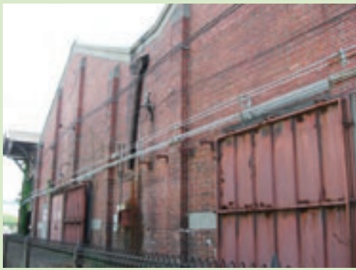
▲住友岸壁の赤レンガ倉庫群 今はクラシックカー博物館

大阪メトロ中央線大阪港駅で下車し、南の臨海地域へ。1937年、中国侵略戦争が全面化する。大棧橋（中央突堤）や住友岸壁、第一、第二、第三突堤から大陸に向けて連日船出した。女性らが出兵を見送り、港