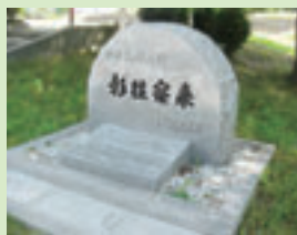
▲日中友好の碑「彰往察来」 大阪中国人強制連行受難者追悼実行委員会が2005年に建立 ▲明治天皇観艦記念塔 天保山公園。