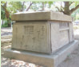
▼軍馬像の台座 築港南公園。軍馬像は金属類回収令で供出されなくなった